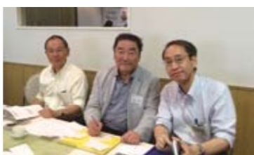
今週の二コニコ3人組