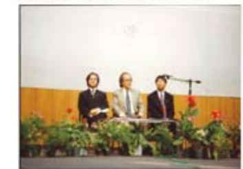
2016 国際会議 イスタンブール