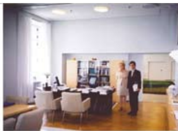
2016 国際会議 イスタンブール