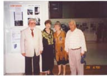
2015 ブルガリア、ソフィア市長訪問