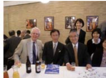
ストックホルム市長と市役所で 議の閉（ノーベル賞授賞式会場）