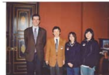
パリ ユーブル美術館開館式に出席