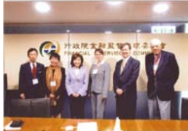
2018 ブルガリア国際建築アカデミー