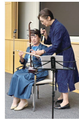
ふれあいコンサートに出演して下さいました